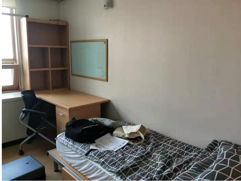
汉阳大学双人宿舍

大家简单熟悉了一下食堂，课程，教室等信息后，开始商量着第二天去哪里玩耍，决定第二天去比较知名的明洞，本来都是兴致勃勃的出发，结果走到一半路的时候，我肚子很难受，因为早上吃了辣辣的饭团，真的发现韩国人都很喜欢冷冷的，辣辣的食物，这一点让大家在学校待到第五天的时候就想吃中国菜，想回家，哈哈。